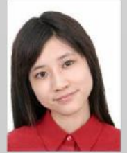
Baş dik değil