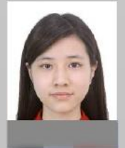
Bozuk veya hasarlı