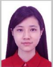
Renk uygun değil