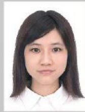
Kıyafet ile fon rengi aynı