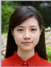
Arka fon düz değil