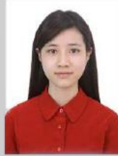
Baş Ölçüsü çok küçük