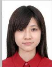
Saç, gözleri kaşları, kulakları kapamış