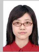
Çerçeve gözleri kapamış