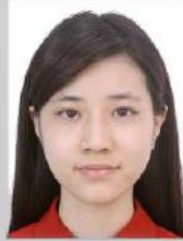
Baş ölçüsü çok büyük